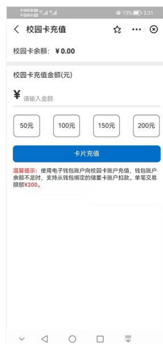
(图 3.2.2 转账)