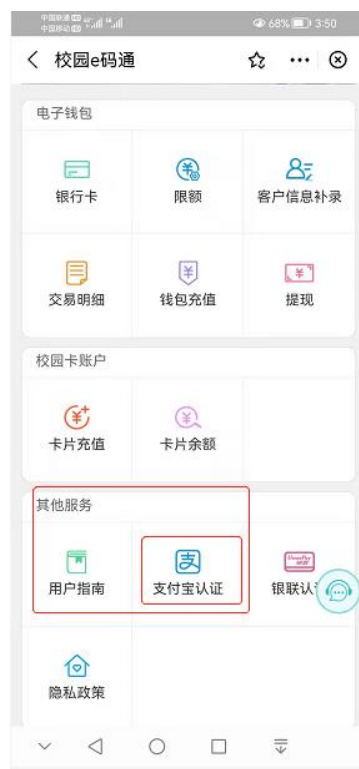
（图 6.1 支付宝认证界面）

在支付里面搜索“校园 E 码通”小程序登陆后，在“校园 E 码通”主页的“其他服务”菜单下，点击“支付宝认证”，认证成功后，在学校餐厅及超市的一卡通 POS 机上直接刷支付宝充值的付款码即可消费（支付宝认证只需要一次），如下图。