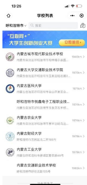
(图 2.1 选择城市及学校)