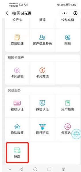
(图 7.1 解绑界面)