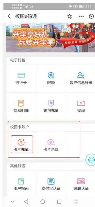
(图 3.2.1 校园卡账户及卡片充值)

在“校园 E 码通”首页中选择“校园卡账户”、选择“卡片充值”后，可以向校园卡中转账。金额可以自己定义。如下图