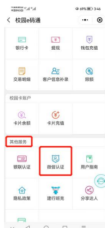
(图 5.1 微信认证界面)

在微信里面搜索“校园 E 码通”小程序登陆后，在“校园 E 码通”主页的“其他服务”菜单下，点击“微信认证”，认证成功后，在学校餐厅及超市的一卡通 POS 机上直接刷微信的付款码即可消费（微信认证只需要一次）。如下图