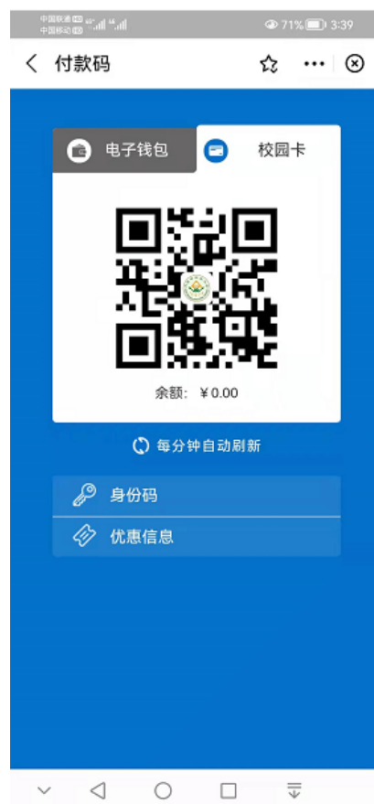
(图 4.2 付款码界面)