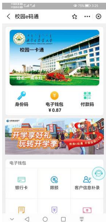
(图 3.1.1 首页)

登录“校园E码通”后，持卡人开通“电子钱包”功能后可以实现银行卡向校园卡充值的功能。如下图：