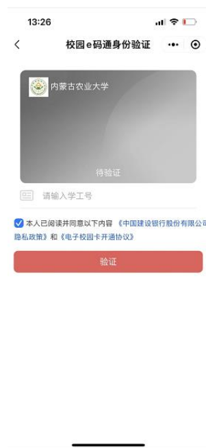
(图 2.2 输入学工号认证)