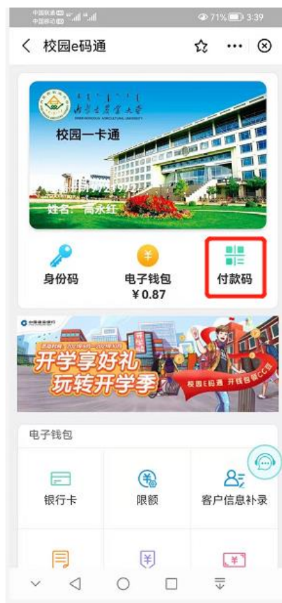
(图 4.1 付款码界面首页)